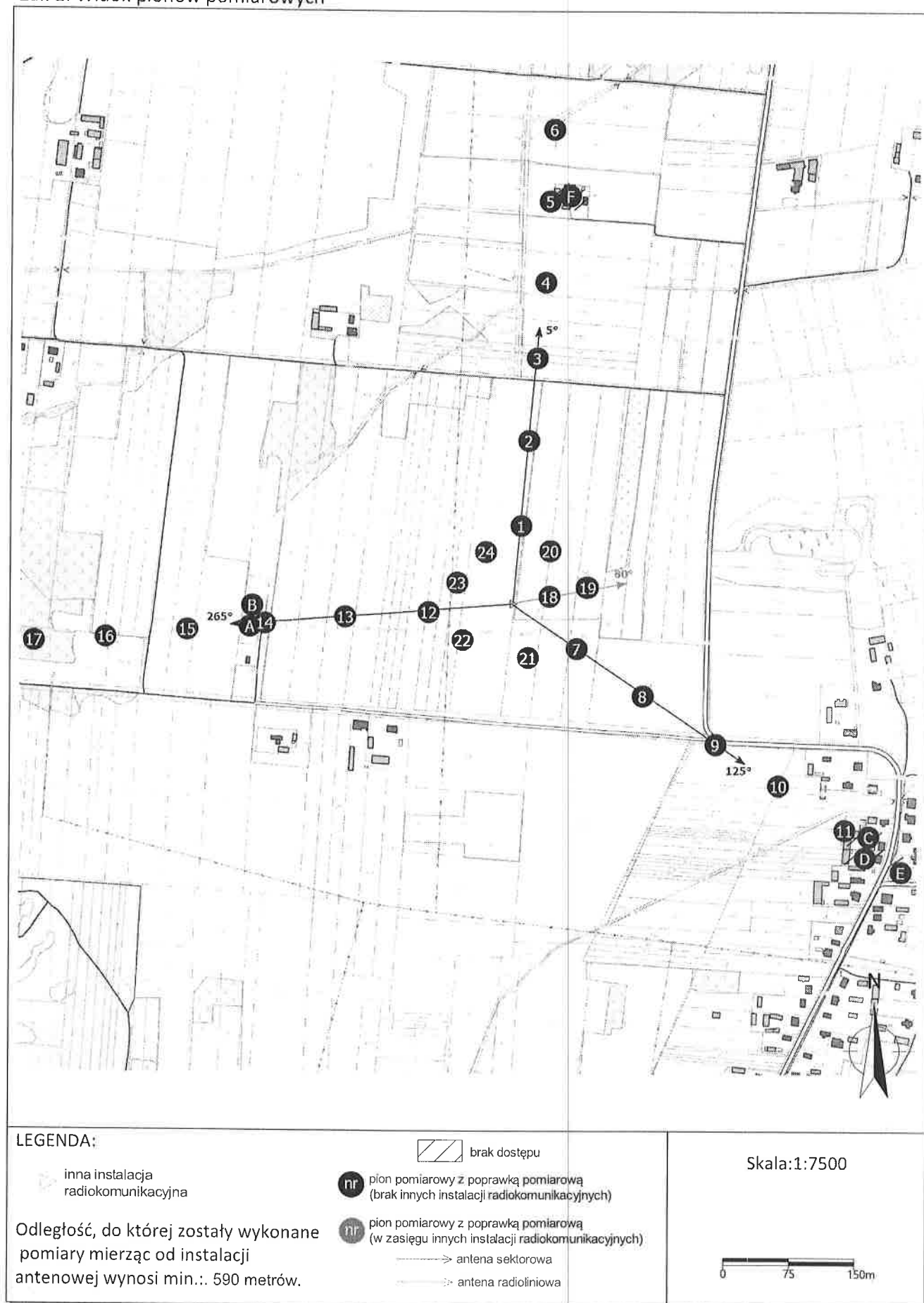
Zał. 2. Widok pionów pomiarowych

„Bez pisemnej zgody Laboratorium niniejsze sprawozdanie nie może być powielane inaczej, jak tylko w całości. Ponadto wyniki dotyczą tylko badanych obiektów przywołanych w niniejszym sprawozdaniu z badań” 95/01/OŚ/2022- P4-W