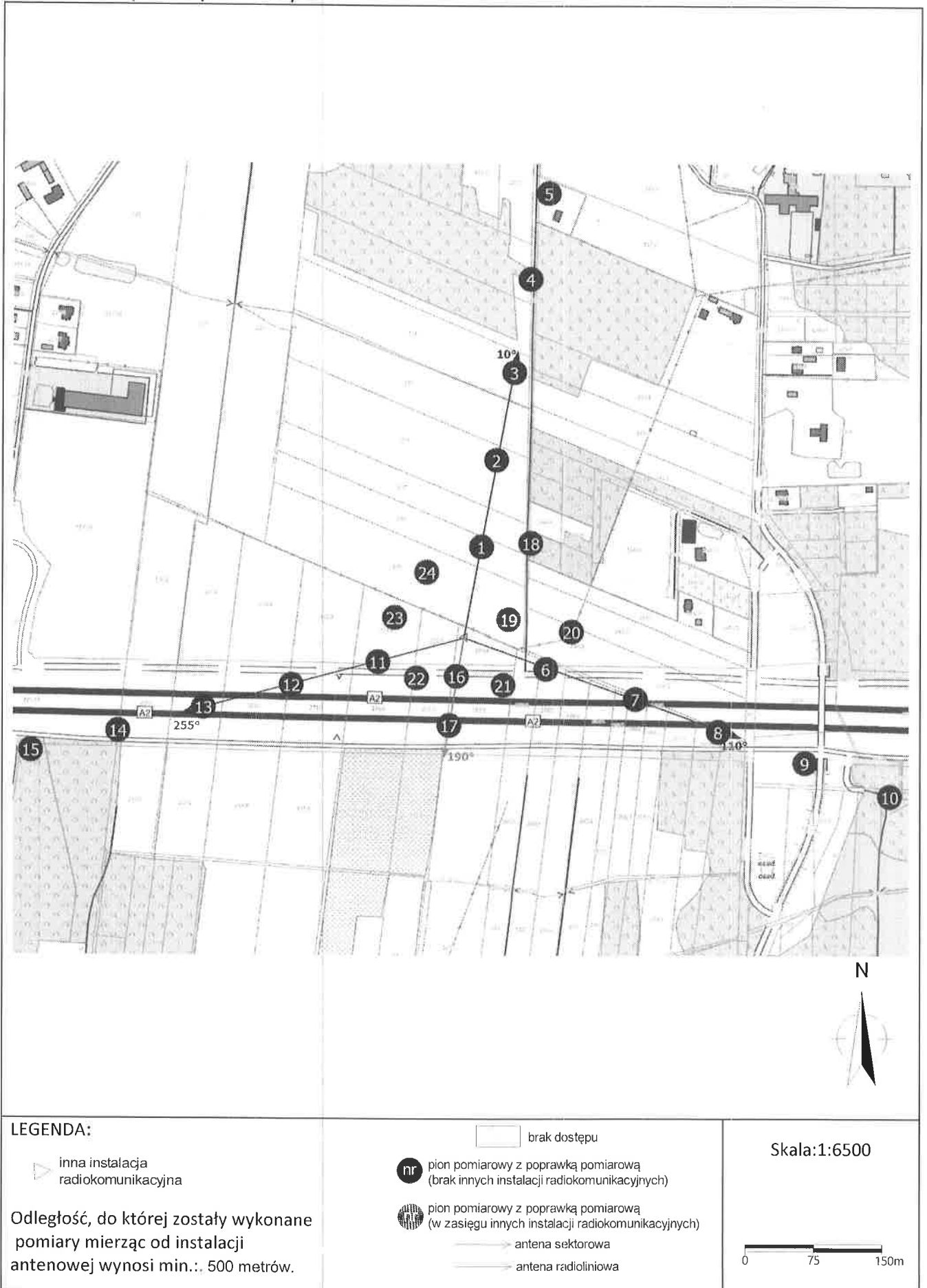
Zał. 2. Widok pionów pomiarowych