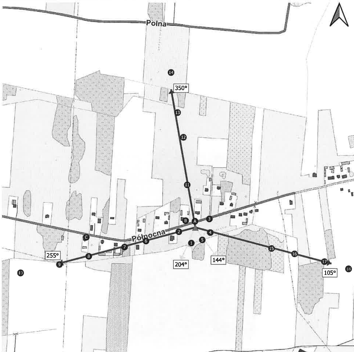
Zał. 2. Widok pionów pomiarowych